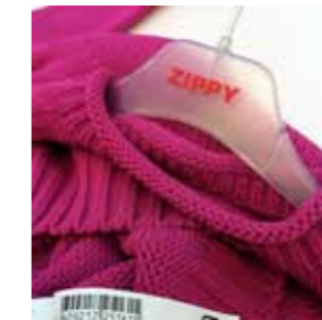
> TÊXTEIS - ZIPPY, MODALFA, BLANKPAGE, DKODE