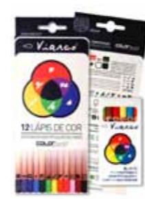
> MATERIAL DIDÁTICO - VIARCO