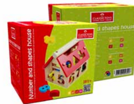
> JOGOS DIDÁTICOS - CLASSIC TOYS