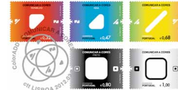
> ACESSIBILIDADES - COLEÇÃO DE SELOS, CTT