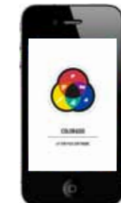
> ColorADD APP