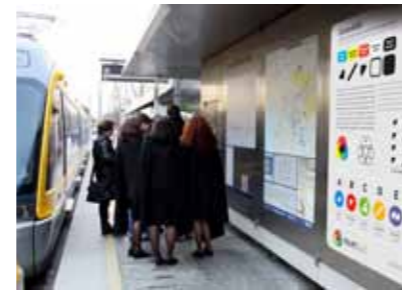
> TRANSPORTES - METRO DO PORTO

Para mais informações, por favor, contacte: info@coloradd.net .