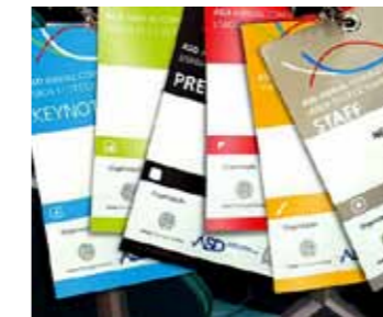
> EVENTOS - ASD ANNUAL CONVENTION AICEP