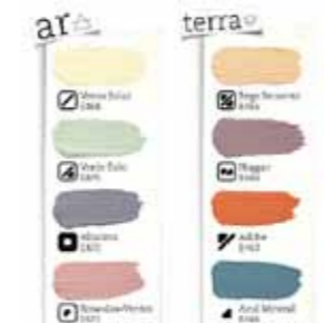
> REVISTIMENTOS - TINTAS CIN